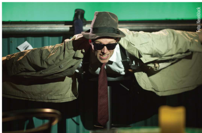
DIE WANZE | Insektenkrimi-Komödie von Paul Shipton

WER PROBT, HAT ANGST (Impro-Wettkampf der Improwerkstatt) | Unlösbare Aufgaben, kein Skript und viel heiteres Scheitern: Beim großen Impro-Wettkampf treten die Mitglieder unserer Improwerkstatt gegeneinander an – spontan, gutgelaunt und völlig unvorbereitet. Aus dem Stegreif entstehen Krimi-Musicals, Stummfilm-Romanzen oder absurde Gameshows. Das Publikum hat in der klatschenden Hand, wer punktet und ins Finale einzieht.