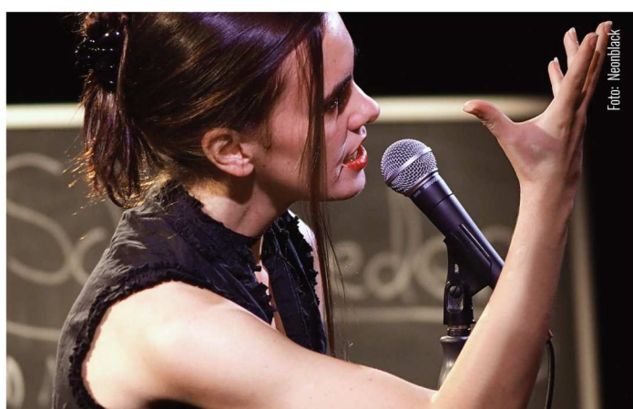
SCHIEFEREDEN | Poetry Slam

DIE WANZE (Insektenkrimi-Komödie von Paul Shipton) | Wanze Muldoon ist der beste – und einzige – Privatdetektiv im Garten. Als Insekten spurlos verschwinden, ahnt der Schnüffler schnell: Der gesamte Garten ist in Gefahr! Diese packende und urkomische Hommage an den Film Noir ist ein Fest der Schauspielkunst. DIE WANZE ist eine absurde, wahnwitzige und schwarze Komödie für Erwachsene.