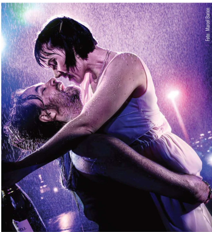
EINE SOMMERNACHT | Schauspiel mit Musik von David Greig und Gordon McIntyre

PREMIERE: EINE SOMMERNACHT (Schauspiel mit Musik von David Greig und Gordon McIntyre) | Ein verregnetes Wochenende, eine Bar und zwei Menschen, die nichts miteinander zu tun haben sollten: Sie ist Scheidungsanwältin mit einem Faible für verheiratete Männer, er ein Kleinkrimineller mit Hang zu schiefen Deals. Ein betrunkenen One-Night-Stand eskaliert zum wilden Streifzug durch die Nacht – mit 15.000 Pfund Diebesgut, einem bekotzten Brautjungferkleid und einer Bruchlandung im Bondage-Club. Zwischen Abstürzen, Selbstzweifeln und überraschenden Geständnissen brennen die beiden Brücken ab – oder finden sie vielleicht einen gemeinsamen Weg nach vorne? Mit zweideutigem Charme, bissigen Dialogen und eingängigen Songs bringt dieser Theaterabend das Genre der romantischen Komödie in die Gegenwart. EINE SOMMERNACHT entsteht in Koproduktion von Bruchwerk Theater und Apollo-Theater Siegen.