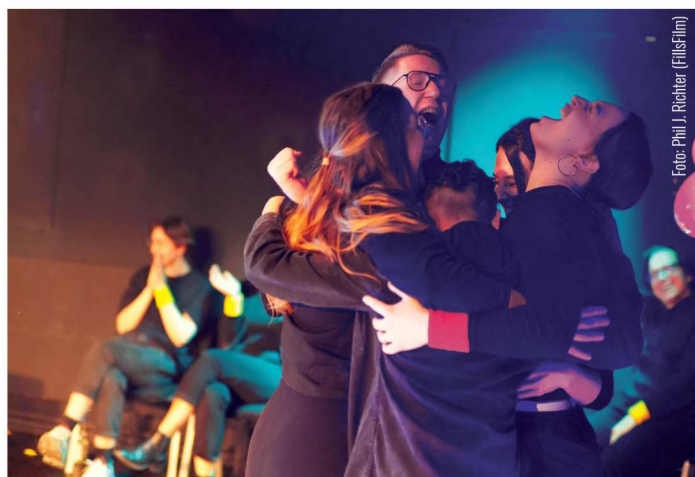
WER PROBT HAT ANGST | Impro-Wettkampf der Improwerkstatt